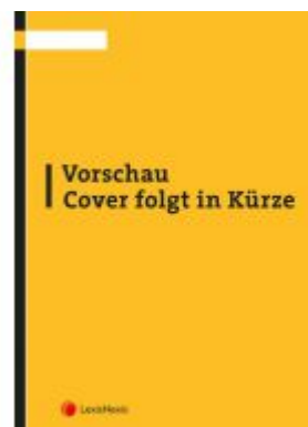
Erfüllungsgehilfen - Gehilfenzurechnung nach ABGB und VersVG Ladenpreis: 54,00 EUR