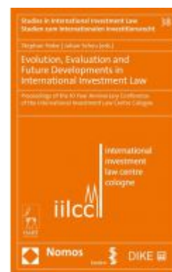
Evolution, Evaluation and Future Developments in International Investment Law