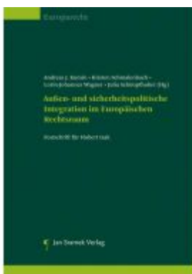
Außen- und sicherheitspolitische Integration im Europäischen Rechtsraum Ladenpreis: 128,00 EUR