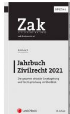
Zak Jahrbuch Zivilrecht 2021 Ladenpreis: 49,00 EUR