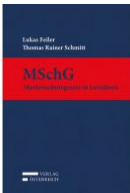
MSchG Ladenpreis: 169,00 EUR

Wir haben andere Produkte gefunden, die Ihnen gefallen könnten!