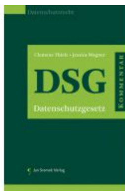
SET Kommentar zur DS-GVO und Kommentar zum DSGVO Ladenpreis: 248,00 EUR