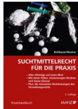
Suchtmittelrecht für die Praxis Ladenpreis: 32,00EUR