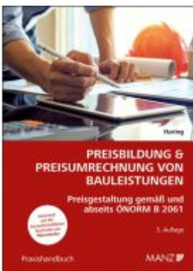
Preisbildung & Preisumrechnung von Bauleistungen Ladenpreis: 52,00EUR