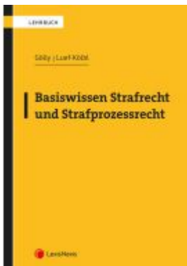
Basiswissen Strafrecht und Strafprozessrecht Ladenpreis: 39,00EUR