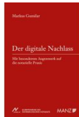
Der digitale Nachlass Ladenpreis: 54,00EUR