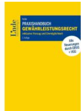
Praxishandbuch Gewährleistungsrecht Ladenpreis: 49,00EUR