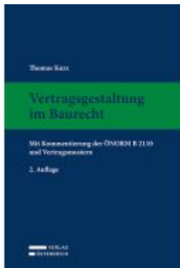
Vertragsgestaltung im Baurecht Ladenpreis: 159,00EUR