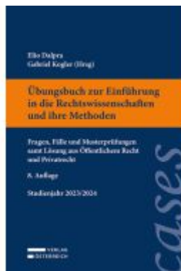
Übungsbuch zur Einführung in die Rechtswissenschaften und ihre Methoden Ladenpreis: 28,00EUR