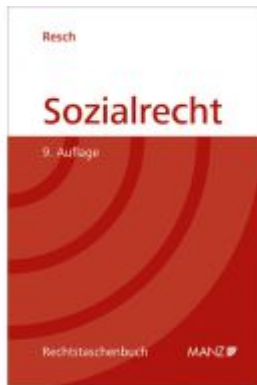
Sozialrecht Ladenpreis: 39,20EUR