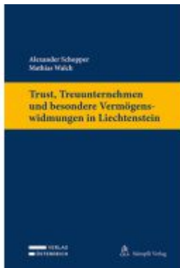
Trust, Treuunternehmen und besondere Vermögenswidmungen in Liechtenstein Ladenpreis: 229,00EUR