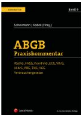
ABGB Praxiskommentar / ABGB Praxiskommentar - Band 9, 5. Auflage Aktionspreis: 191,20 EUR Ladenpreis: 239,00 EUR

Wir haben andere Produkte gefunden, die Ihnen gefallen könnten!