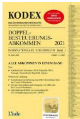
KODEX Doppelbesteuerungsabkommen 2021 Ladenpreis: 65,00 EUR