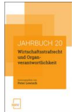
Wirtschaftsstrafrecht und Organverantwortlichkeit Ladenpreis: 58,00 EUR