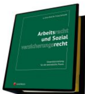
Arbeitsrecht und Sozialversicherungsrecht Ladenpreis: 373,00 EUR