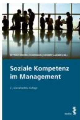
Soziale Kompetenz im Management Ladenpreis: 30,00 EUR