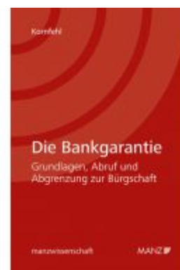
Die Bankgarantie Ladenpreis: 46,00 EUR