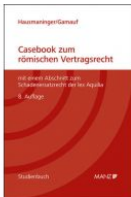
Casebook zum römischen Vertragsrecht Ladenpreis: 44,40 EUR