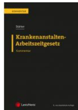
Krankenanstalten-Arbeitszeitgesetz KA- AZG Ladenpreis: 69,00 EUR