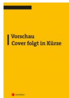
Verwaltungsverfahren (Skriptum) Ladenpreis: 21,00 EUR