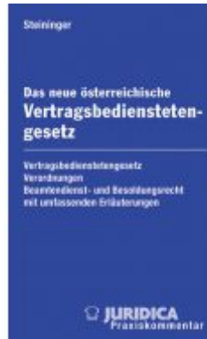
Das neue österreichische Vertragsbedienstetengesetz Ladenpreis: 128,00 EUR