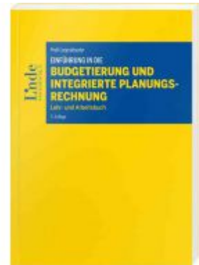
Einführung in die Budgetierung und integrierte Planungsrechnung Ladenpreis: 36,00 EUR