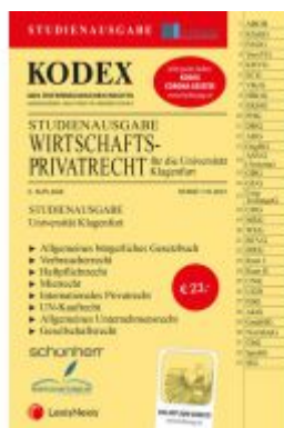
KODEX Wirtschaftsprivat recht Klagenfurt - inkl. App Ladenpreis: 23,00 EUR