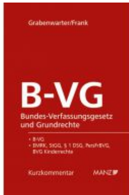
Bundes-Verfassungsgesetz und Grundrechte B-VG Ladenpreis: 98,00 EUR