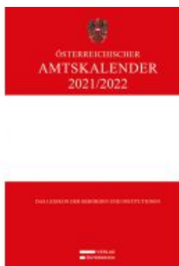
Österreichischer Amtskalender 2021/2022 Ladenpreis: 298,00 EUR