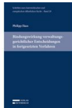
Bindungswirkung verwaltungsgerichtlicher Entscheidungen in fortgesetzten Verfahren Ladenpreis: 89,00 EUR