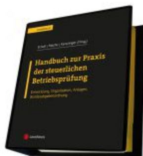
Handbuch zur Praxis der steuerlichen Betriebsprüfung Ladenpreis: 400,00 EUR