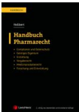
Handbuch Pharmarecht Ladenpreis: 89,00 EUR