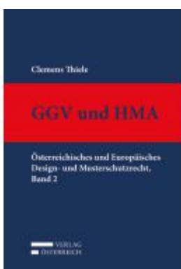
GGV und HMA Ladenpreis: 329,00 EUR