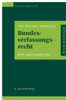
Kommentar zum Bundesverfassungsrecht Ladenpreis: 248,00 EUR