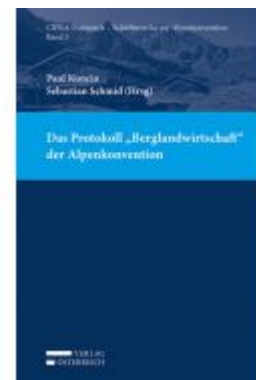
Das Protokoll "Berglandwirtschaft" der Alpenkonvention Ladenpreis: 42,00 EUR