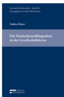
Die Nachschussobligaten in der Gesellschaftskrise Ladenpreis: 79,00 EUR