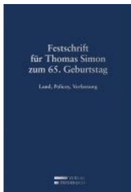
Festschrift für Thomas Simon zum 65. Geburtstag Ladenpreis: 109,00 EUR