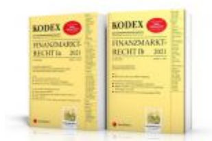
KODEX Finanzmarktrecht Band Ia + Ib 2021 - inkl. App Ladenpreis: 95,00 EUR