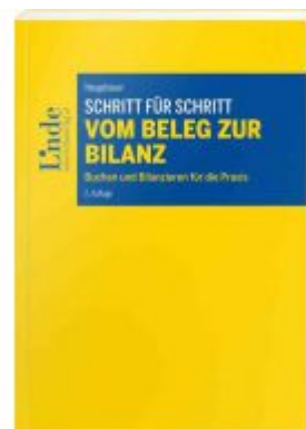
Schritt für Schritt vom Beleg zur Bilanz Ladenpreis: 38,00 EUR