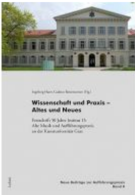
Wissenschaft und Praxis – Altes und Neues Ladenpreis: 19,90 EUR