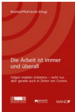
Die Arbeit ist immer und überall Folgen mobilen Arbeiters - nicht nur, aber gerade auch in Zeiten von Corona Ladenpreis: 36,00 EUR

Wir haben andere Produkte gefunden, die Ihnen gefallen könnten!