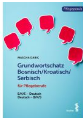
Grundwortschatz Bosnisch/Kroatisch/Serbisch für Pflegeberufe Ladenpreis: 18,90 EUR