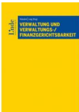
Verwaltung und Verwaltungs- /Finanzgerichtsbarkeit Ladenpreis: 98,00 EUR