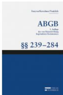
Großkommentar zum ABGB - Klang Kommentar Ladenpreis: 239,00 EUR