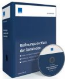
Rechnungsabschluss der Gemeinden Ladenpreis: 207,90 EUR