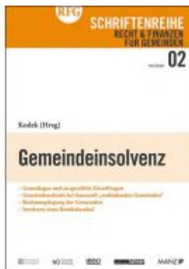
Gemeindeinsolvenz Ladenpreis: 24,00 EUR