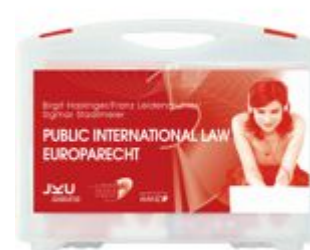
Medienkoffer Public International Law / Europarecht Ladenpreis: 283,80 EUR