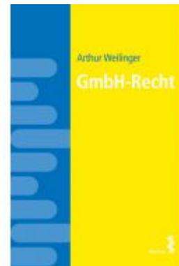
GmbH-Recht Ladenpreis: 18,00 EUR