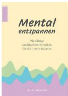
Mental entspannen Ladenpreis: 15,00 EUR