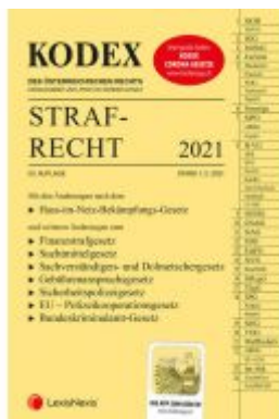
KODEX Strafrecht 2021 Ladenpreis: 36,00 EUR