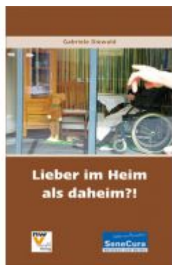
Lieber ins Heim als daheim?! Ladenpreis: 24,80 EUR