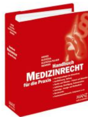
Handbuch Medizinrecht für die Praxis Ladenpreis: 198,00 EUR