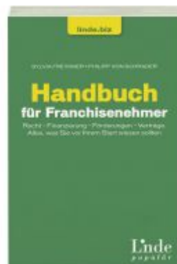
Handbuch für Franchisenehmer Ladenpreis: 19,90 EUR