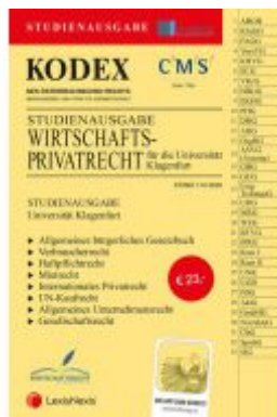
KODEX Wirtschaftsprivatrecht Klagenfurt Ladenpreis: 23,00 EUR