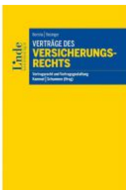
Verträge des Versicherungsrechts Ladenpreis: 48,00 EUR