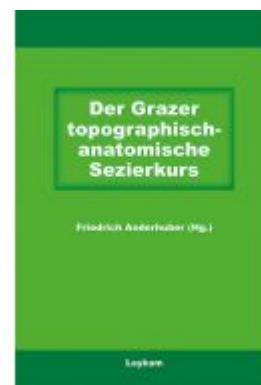
Der Grazer topographisch-anatomische Sezierkurs Ladenpreis: 12,90 EUR