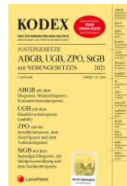
KODEX Justizgesetze 2021 Ladenpreis: 29,00 EUR