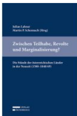
Zwischen Teilhabe, Revolte und Marginalisierung? Die Stände der österreichischen Länder in der Neuzeit (1500-1848/49) Ladenpreis: 59,00EUR