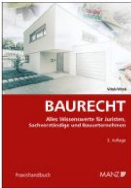
Baurecht Ladenpreis: 48,00EUR