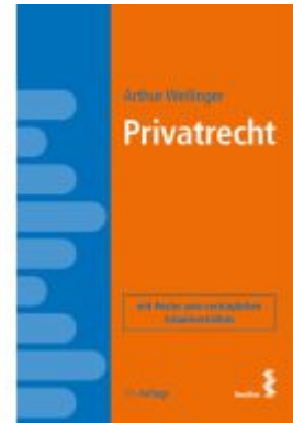
Privatrecht Ladenpreis: 48,00EUR