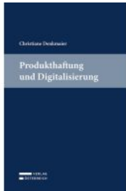
Produkthaftung und Digitalisierung Ladenpreis: 69,00EUR