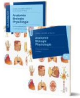
Lernpaket Anatomie, Biologie, Physiologie I Ladenpreis: 56,90EUR