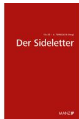
Der Sideletter Ladenpreis: 48,00EUR