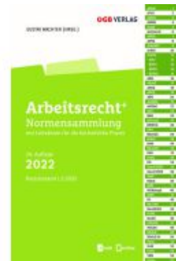
Arbeitsrecht+ Ladenpreis: 59,00EUR