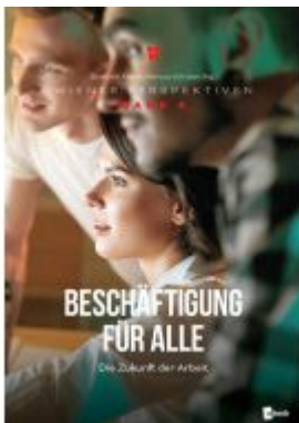
Beschäftigung für alle Ladenpreis: 29,90EUR

Wir haben andere Produkte gefunden, die Ihnen gefallen könnten!