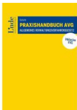
Praxishandbuch AVG | Allgemeines Verwaltungsverfahrensgesetz Ladenpreis: 49,00EUR