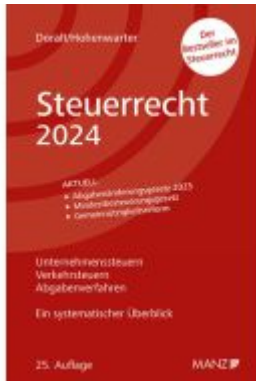
Steuerrecht 2024 Ladenpreis: 39,00EUR

Wir haben andere Produkte gefunden, die Ihnen gefallen könnten!