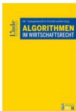
Algorithmen im Wirtschaftsrecht Ladenpreis: 69,00EUR