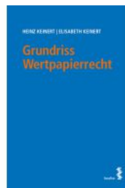
Grundriss Wertpapierrecht Ladenpreis: 26,00EUR