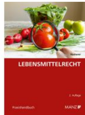
Lebensmittelrecht Ladenpreis: 48,00EUR

Alle Preise inkl. MwSt. zzgl. Versand. Bei Bestellung im LexisNexis Onlineshop kostenloser Versand innerhalb Österreichs.