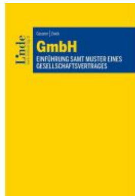
GmbH Ladenpreis: 49,00EUR