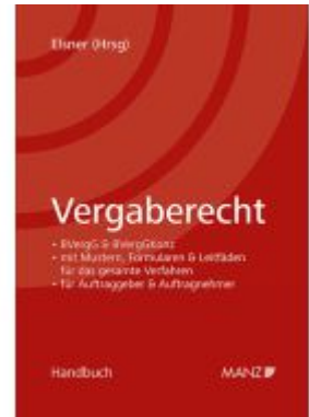
Vergaberecht Ladenpreis: 128,00EUR