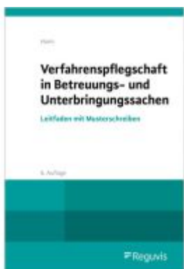
Verfahrenspflegschaft in Betreuungs- und Unterbringungssachen Ladenpreis: 29,90EUR