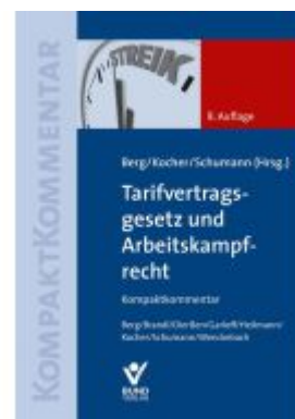
Tarifvertragsgesetz und Arbeitskampfrecht Ladenpreis: 121,40EUR