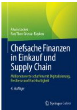
Chefsache Finanzen in Einkauf und Supply Chain Ladenpreis: 82,23EUR