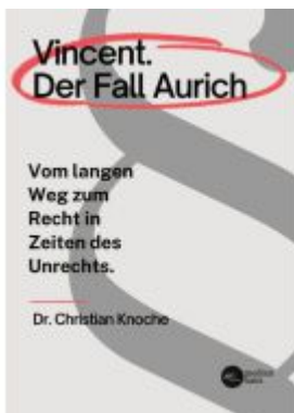
Vincent. Der Fall Aurich Ladenpreis: 16,99EUR

Wir haben andere Produkte gefunden, die Ihnen gefallen könnten!