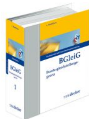
Bundesgleichstellungsgesetz - BGleG Ladenpreis: 623,00EUR