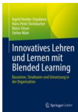
Innovatives Lehren und Lernen mit Blended Learning Ladenpreis: 46,25EUR