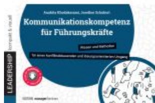
Kommunikationskompetenz für Führungskräfte Ladenpreis: 25,60EUR