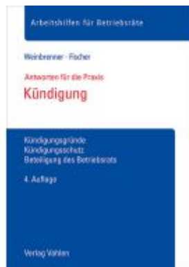
Kündigung Ladenpreis: 23,60EUR