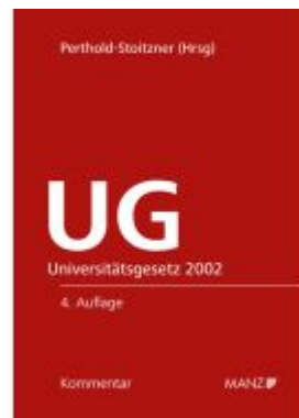
Kommentar zum Universitätsgesetz 2002 Ladenpreis: 198,00EUR