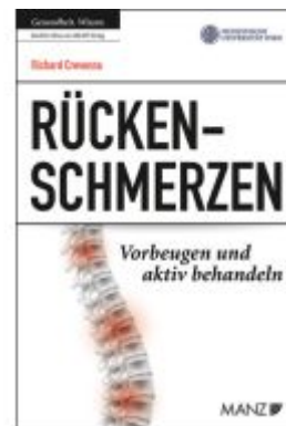
Rückenschmerzen Vorbeugen und aktiv behandeln Ladenpreis: 23,90EUR