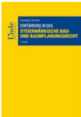
Einführung in das Steiermärkische Bau- und Raumplanungsrecht Ladenpreis: 62,00EUR

Wir haben andere Produkte gefunden, die Ihnen gefallen könnten!