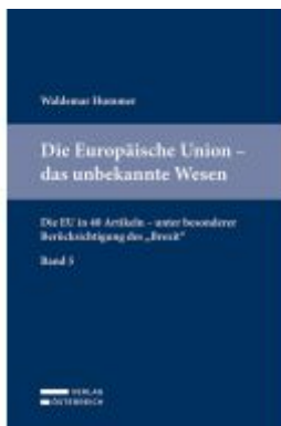
Die Europäische Union - das unbekannte Wesen Ladenpreis: 54,00EUR