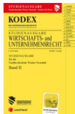
KODEX Wirtschafts- und Unternehmensrecht 2023 Band II - inkl. App Ladenpreis: 22,50EUR