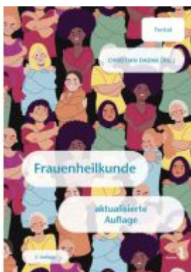
Frauenheilkunde Ladenpreis: 24,90EUR