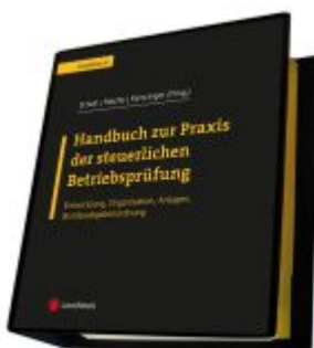
Handbuch zur Praxis der steuerlichen Betriebsprüfung Ladenpreis: 400,00EUR