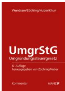
Umgründungssteuergesetz UmgrStG Ladenpreis: 178,00EUR