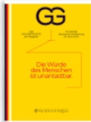
Das Grundgesetz als Magazin - 75 Jahre Ladenpreis: 10,00EUR