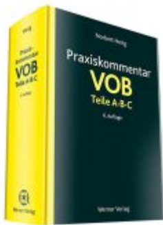
Praxiskommentar VOB Teile A, B und C Ladenpreis: 81,30EUR

Wir haben andere Produkte gefunden, die Ihnen gefallen könnten!