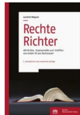
Rechte Richter Ladenpreis: 29,90EUR