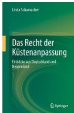
Das Recht der Küstenanpassung Ladenpreis: 102,79EUR