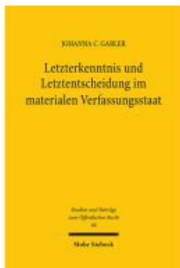
Letzterkenntnis und Letztentscheidung im materialen Verfassungsstaat Ladenpreis: 112,10EUR