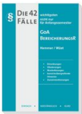
Die 42 wichtigsten Fälle GoA / Bereicherungsrecht Ladenpreis: 15,30EUR