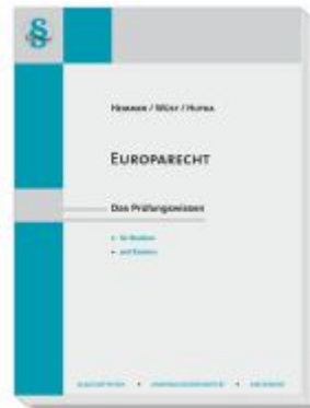
Europarecht Ladenpreis: 22,50EUR