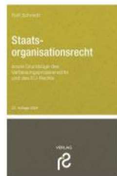
Staatsorganisationsrecht Ladenpreis: 27,60EUR