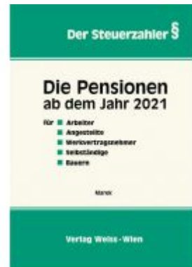
Die Pensionen ab dem Jahr 2021 Ladenpreis: 47,30 EUR