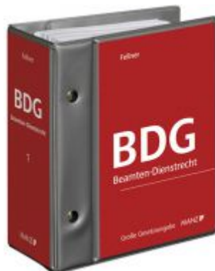
Beamten-Dienstrechtsgesetz Ladenpreis: 332,00 EUR