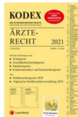
KODEX Ärzterecht 2021 Ladenpreis: 95,00 EUR