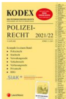
KODEX Polizeirecht 2021/22 Ladenpreis: 58,00 EUR