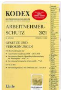
KODEX Arbeitnehmerschutz 2021 Ladenpreis: 37,00 EUR

Wir haben andere Produkte gefunden, die Ihnen gefallen könnten!