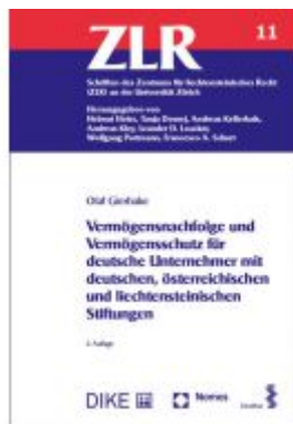
Vermögensnachfolge und Vermögensschutz für deutsche Unternehmer mit deutschen, österreichischen und liechtensteinischen Stiftungen Ladenpreis: 88,40 EUR