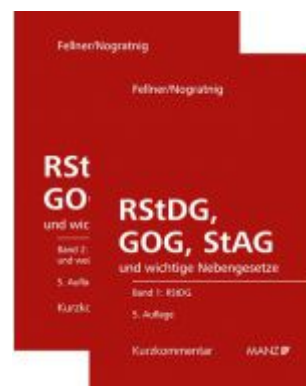
RStDG, GOG und StAG Richter- und StaatsanwaltschaftsdienstG und GerichtszuständigkeitsG Ladenpreis: 298,00 EUR