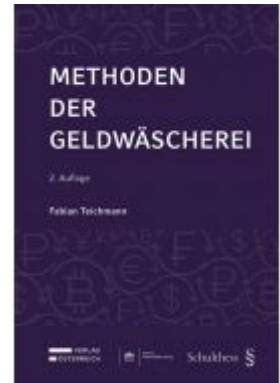
Methoden der Geldwäscherei Ladenpreis: 115,00 EUR