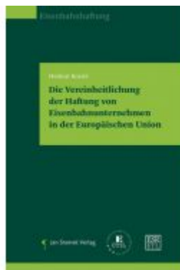
Die Vereinheitlichung der Haftung von Eisenbahnunternehmen in der Europäischen Union Ladenpreis: 59,90 EUR