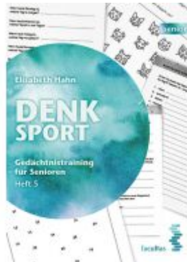
Denksport Ladenpreis: 14,90 EUR