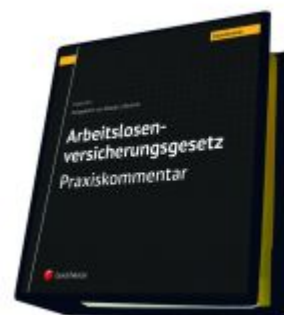
Arbeitslosenversicherungsgesetz - Praxiskommentar Ladenpreis: 290,00 EUR