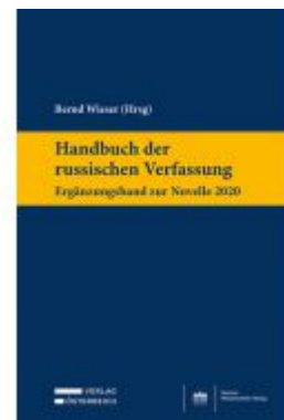
Handbuch der russischen Verfassung - Ergänzungsband zur Novelle 2020 Ladenpreis: 149,00 EUR