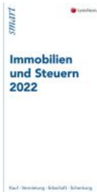
Immobilien und Steuern 2022 Ladenpreis: 12,00 EUR