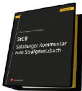
Salzburger Kommentar zum Strafgesetzbuch Ladenpreis: 498,00 EUR

Wir haben andere Produkte gefunden, die Ihnen gefallen könnten!