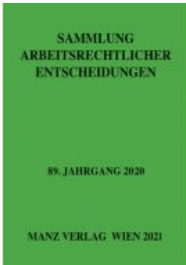
Sammlung arbeitsrechtlicher Entscheidungen Ladenpreis: 96,00 EUR