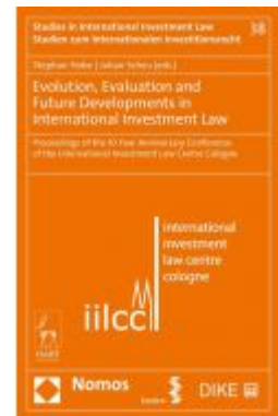
Evolution, Evaluation and Future Developments in International Investment Law Ladenpreis: 53,50 EUR