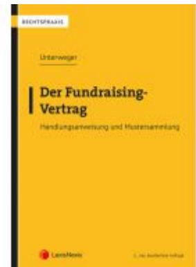
Der Fundraising-Vertrag Ladenpreis: 27,00 EUR