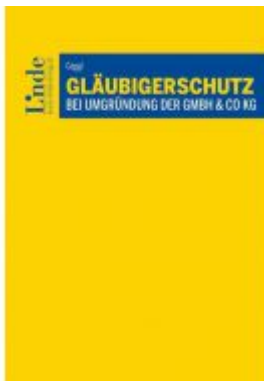
Gläubigerschutz bei Umgründung der GmbH & Co KG Ladenpreis: 79,00 EUR

Wir haben andere Produkte gefunden, die Ihnen gefallen könnten!