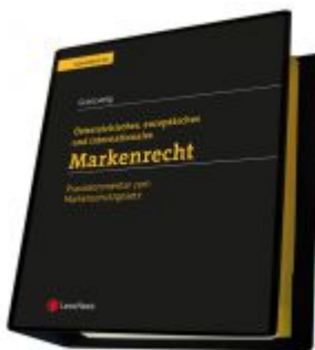
Markenrecht - Praxiskommentar zum Markenschutzgesetz Ladenpreis: 230,00 EUR