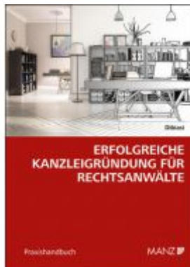
Erfolgreiche Kanzleigründung für Rechtsanwälte Ladenpreis: 34,00 EUR