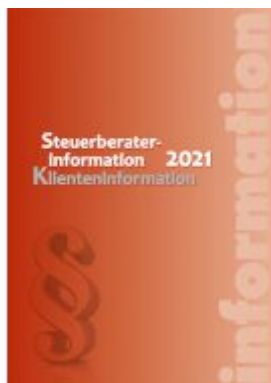
Steuerberaterinformation 2021 Ladenpreis: 44,90 EUR