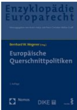
Europäische Querschnittspolitiken Ladenpreis: 174,80 EUR