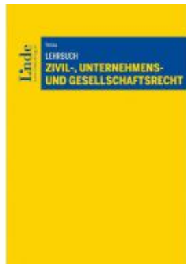
Lehrbuch Zivil-, Unternehmens- und Gesellschaftsrecht Ladenpreis: 44,00 EUR