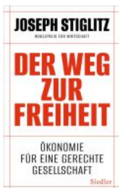
Der Weg zur Freiheit Ladenpreis: 28,80EUR