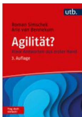
Agilität? Frag doch einfach! Ladenpreis: 20,50EUR