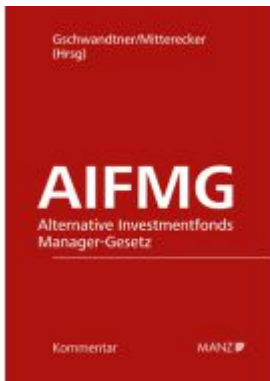
Alternative Investmentfonds Manager-Gesetz AIFMG Ladenpreis: 298,00EUR

Wir haben andere Produkte gefunden, die Ihnen gefallen könnten!