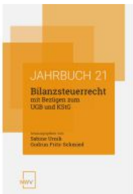
Bilanzsteuerrecht mit Bezügen zum UGB und KStG