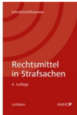
Rechtsmittel in Strafsachen Ladenpreis: 48,00EUR