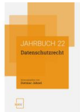
Datenschutzrecht Ladenpreis: 64,00EUR