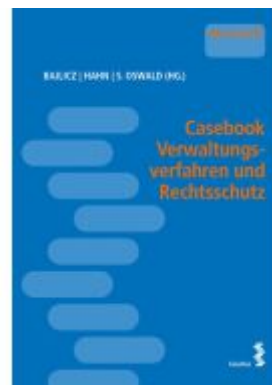
Casebook Verwaltungsverfahren und Rechtsschutz