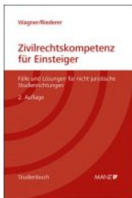
Zivilrechtskompetenz für Einsteiger Fälle und Lösungen für nicht-juristische Studienrichtungen