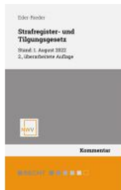
Strafregister- und Tilgungsgesetz Ladenpreis: 68,00EUR