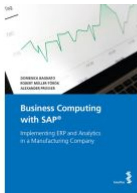
Business Computing with SAP®