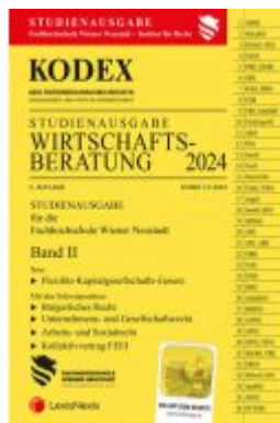
KODEX Wirtschaftsberatung 2024 Band II - inkl. App Ladenpreis: 22,00EUR