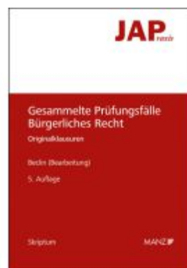
JAP - Gesammelte Prüfungsfälle Bürgerliches Recht Ladenpreis: 36,00EUR