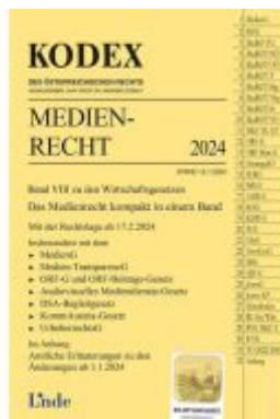
KODEX Medienrecht Ladenpreis: 37,00EUR