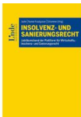
Insolvenz- und Sanierungsrecht Ladenpreis: 69,00EUR