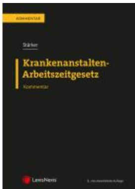
Krankenanstalten-Arbeitszeitgesetz KA-AZG Ladenpreis: 69,00EUR