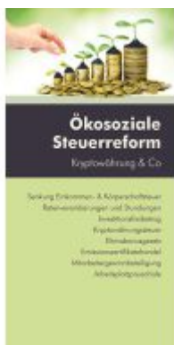
Ökosoziale Steuerreform Ladenpreis: 12,60EUR