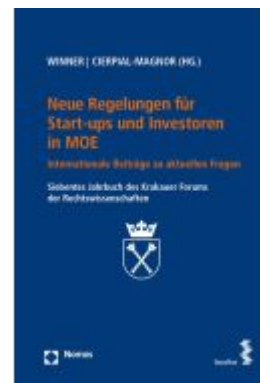
Neue Regelungen für Start-ups und Investoren in MOE Ladenpreis: 38,00EUR