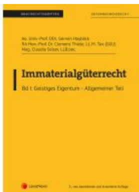
Immaterialgüterrecht (Skriptum) - Bd I Ladenpreis: 13,00EUR