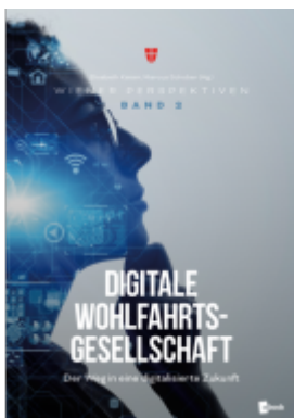
Digitale Wohlfahrts-Gesellschaft Ladenpreis: 24,00EUR