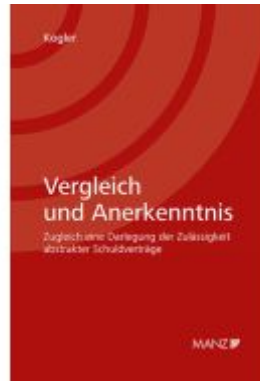
Vergleich und Anerkenntnis Ladenpreis: 84,00EUR