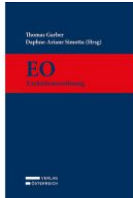
Exekutionsordnung Ladenpreis: 519,00EUR