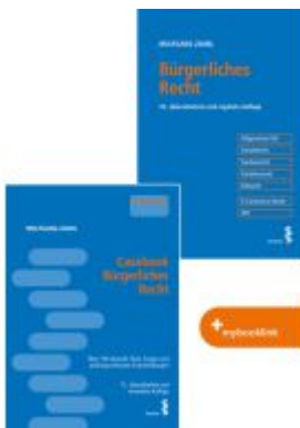
Kombipaket Casebook Bürgerliches Recht und Bürgerliches Recht Ladenpreis: 86,00EUR