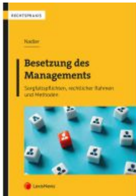
Besetzung des Managements Ladenpreis: 42,00EUR