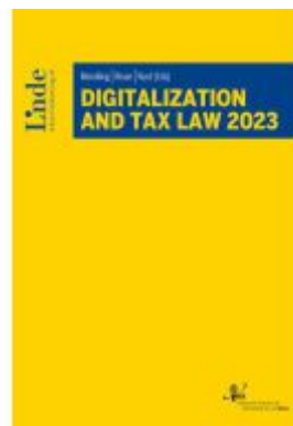
Digitalization And Tax Law 2023 Ladenpreis: 139,00EUR