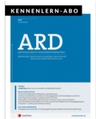
ARD Zeitschrift - Kennenlern-Abo (4 Hefte) Ladenpreis: 50,00EUR