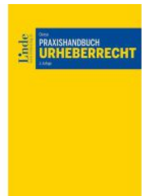
Praxishandbuch Urheberrecht Ladenpreis: 78,00EUR