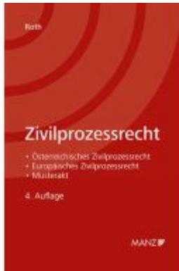
Zivilprozessrecht Ladenpreis: 44,00EUR