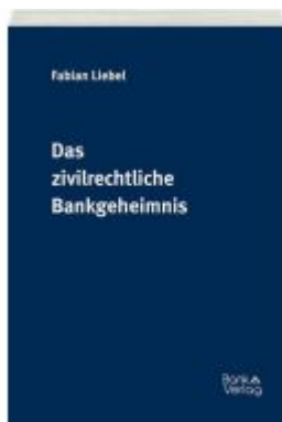
Das zivilrechtliche Bankgeheimnis Ladenpreis: 50,00 EUR