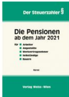
Die Pensionen ab dem Jahr 2021 Ladenpreis: 47,30 EUR