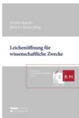
Leichenöffnung für wissenschaftliche Zwecke