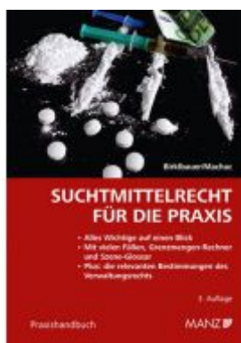
Suchtmittelrecht für die Praxis