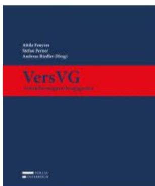
VersVG - Versicherungsvertragsgesetz