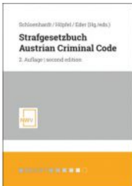
Strafgesetzbuch / Austrian Criminal Code Ladenpreis: 98,00 EUR