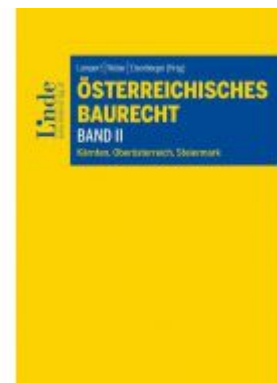
Österreichisches Baurecht Band II Ladenpreis: 39,00 EUR