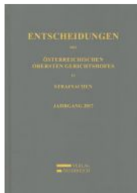
Entscheidungen des Österreichischen Obersten Gerichtshofes in Strafsachen Ladenpreis: 179,00 EUR