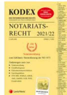
KODEX Notariatsrecht 2021/22 - inkl. App Ladenpreis: 45,00 EUR