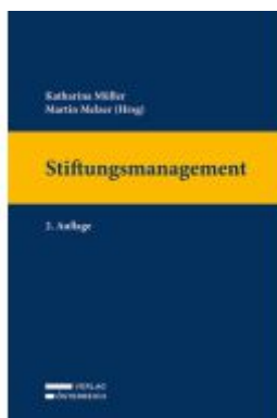
Stiftungsmanagement Ladenpreis: 149,00EUR