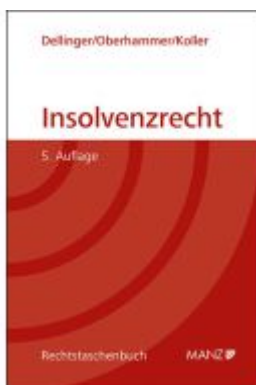
Insolvenzrecht Ladenpreis: 48,00EUR