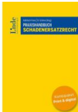
Praxishandbuch Schadenersatzrecht (Kombi Print&digital) Ladenpreis: 99,00EUR