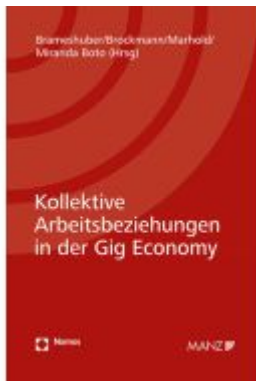
Kollektive Arbeitsbeziehungen in der Gig Economy Ladenpreis: 64,00EUR

Wir haben andere Produkte gefunden, die Ihnen gefallen könnten!