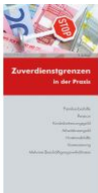
Zuverdienstgrenzen in der Praxis Ladenpreis: 13,20EUR