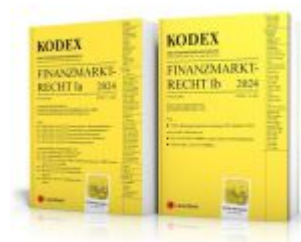
KODEX Finanzmarktrecht Band Ia + Ib 2024 - inkl. App Ladenpreis: 103,00EUR