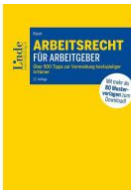
Arbeitsrecht für Arbeitgeber Ladenpreis: 104,00EUR