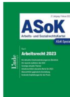
ASoK-Spezial Arbeitsrecht 2023 Ladenpreis: 29,00EUR