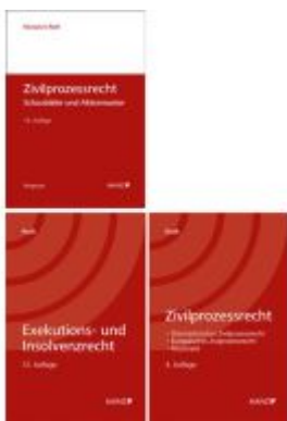
PAKET: Zivilprozessrecht 4.Auflage+ Zivilprozessrecht Schaubilder und Aktenmuster 14.Auflage+ Exekutions-und InsolvenzR 12.Auflage Ladenpreis: 124,20EUR