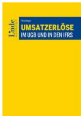
Umsatzerlöse im UGB und in den IFRS Ladenpreis: 78,00EUR