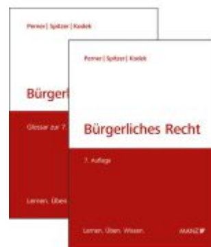
Bürgerliches Recht Ladenpreis: 72,00EUR