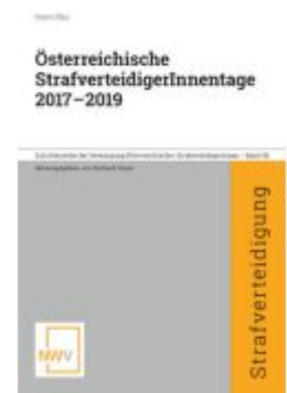
Österreichische StrafverteidigerInnentage 2017 — 2019 Ladenpreis: 68,00EUR