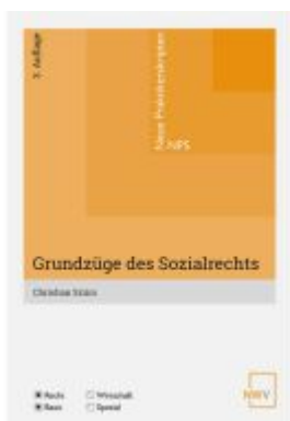
Grundzüge des Sozialrechts Ladenpreis: 23,00EUR