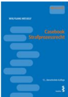
Casebook Strafprozessrecht Ladenpreis: 28,00EUR