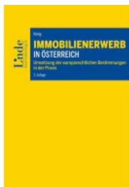
Immobilienwerb in Österreich Ladenpreis: 60,00EUR