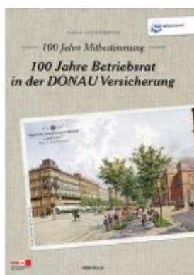
100 Jahre Mitbestimmung Ladenpreis: 29,90 EUR