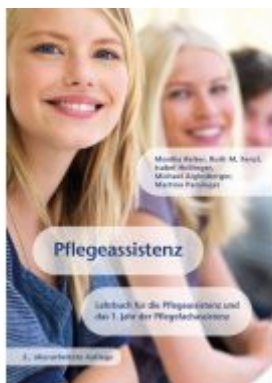
Pflegeassistent Ladenpreis: 49,90 EUR