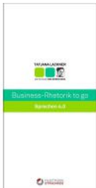
Business-Rhetorik to go Ladenpreis: 19,80 EUR