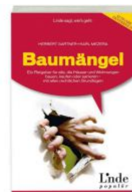
Baumängel Ladenpreis: 19,90 EUR