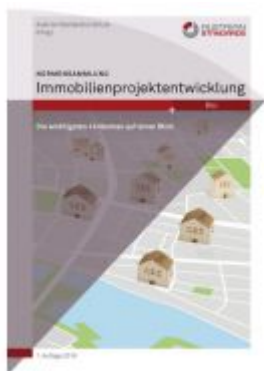
Normensammlung Immobilienprojektentwicklung Ladenpreis: 251,90 EUR