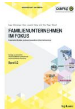
Familienunternehmen im Fokus. Empirische Studien zu einem besonderen Unternehmenstyp Ladenpreis: 17,00 EUR