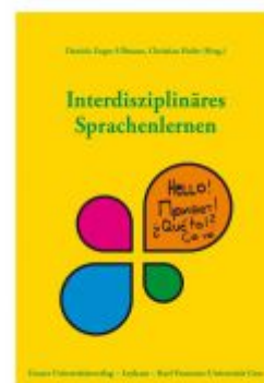
Interdisziplinäres Sprachenlernen Ladenpreis: 19,90 EUR