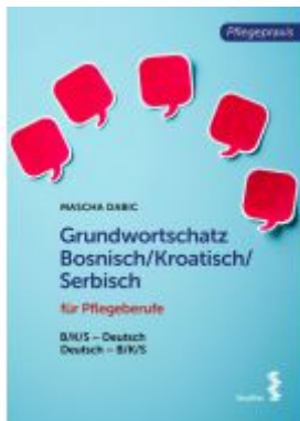
Grundwortschatz Bosnisch/Kroatisch/Serbisch für Pflegeberufe Ladenpreis: 18,90 EUR