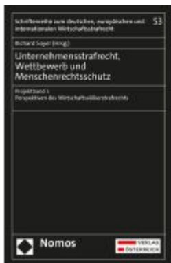
Unternehmensstrafrecht, Wettbewerb und Menschenrechtsschutz Ladenpreis: 249,00EUR