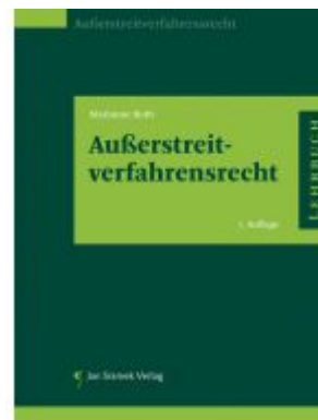
Außerstreitverfahrensrecht Ladenpreis: 29,90EUR