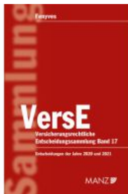
Versicherungsrechtliche Entscheidungssammlung VersE Ladenpreis: 298,00EUR