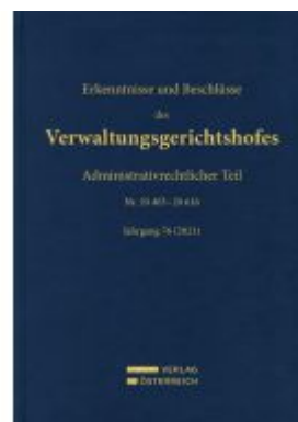
Erkenntnisse und Beschlüsse des Verwaltungsgerichtshofes Ladenpreis: 549,00EUR