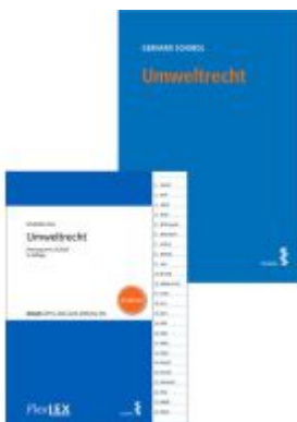
Kombipaket Umweltrecht und FlexLex Umweltrecht | Studium Ladenpreis: 53,00EUR