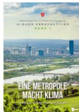
Eine Metropole macht Klima Ladenpreis: 24,00EUR