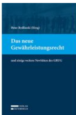
Das neue Gewährleistungsrecht Ladenpreis: 59,00EUR