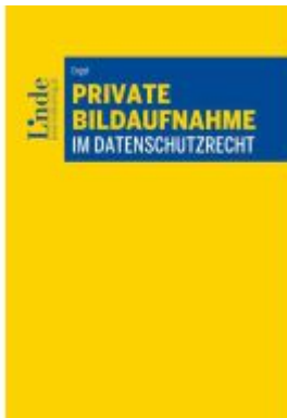
Private Bildaufnahme im Datenschutzrecht Ladenpreis: 46,00EUR