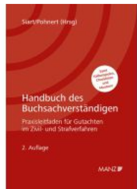
Handbuch des Buchsachverständigen Ladenpreis: 118,00EUR