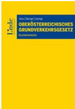
Oberösterreichisches Grundverkehrsgesetz Ladenpreis: 55,00EUR