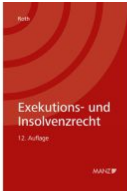
Exekutions- und Insolvenzrecht Ladenpreis: 52,00EUR