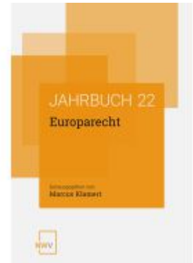
Europarecht Ladenpreis: 78,00EUR