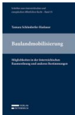
Baulandmobilisierung Ladenpreis: 64,00EUR