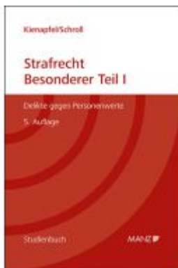
Strafrecht - Besonderer Teil I Ladenpreis: 61,00EUR