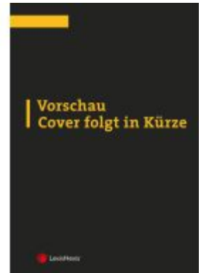
BAO Bundesabgabenordnung – Stoll Kommentar Band 1 Aktionspreis: 96,00EUR Ladenpreis: 120,00EUR