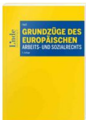
Grundzüge des europäischen Arbeits- und Sozialrechts Ladenpreis: 34,00 EUR