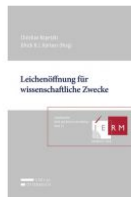
Leichenöffnung für wissenschaftliche Zwecke Ladenpreis: 58,00 EUR