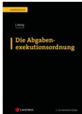
Die Abgabenexekutionsordnung Ladenpreis: 75,00 EUR