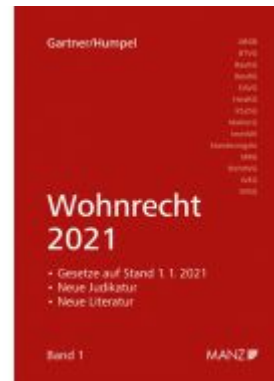
Wohnrecht 2021 Ladenpreis: 44,00 EUR