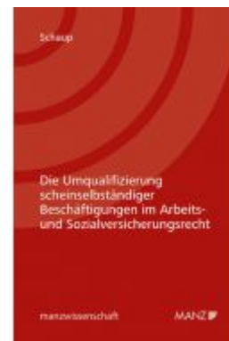
Die Umqualifizierung scheinselbständiger Beschäftigten im Arbeits- und Sozialversicherungsrecht Ladenpreis: 56,00 EUR