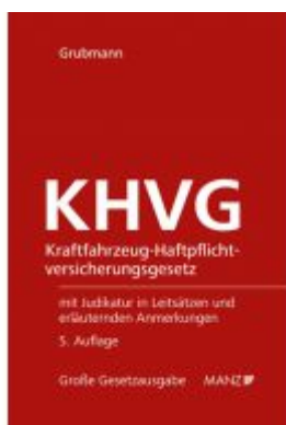
Kraftfahrzeug- Haftpflichtversicherungsgesetz KHVG Ladenpreis: 118,00 EUR