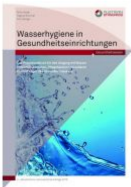
Wasserhygiene in Gesundheitseinrichtungen Ladenpreis: 97,90 EUR

Wir haben andere Produkte gefunden, die Ihnen gefallen könnten!