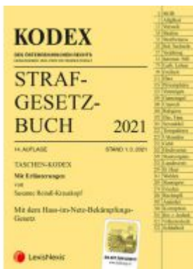
Taschen-Kodex Strafgesetzbuch 2021 Ladenpreis: 15,00 EUR