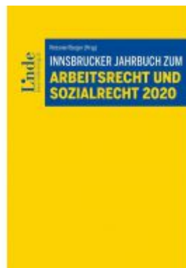
Innsbrucker Jahrbuch zum Arbeits- und Sozialrecht 2020 Ladenpreis: 52,00 EUR