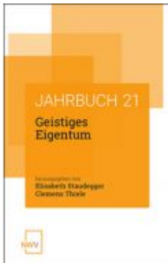
Geistiges Eigentum Ladenpreis: 68,00 EUR