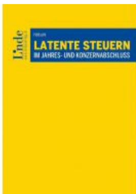
Latente Steuern im Jahres- und Konzernabschluss Ladenpreis: 66,00 EUR

Wir haben andere Produkte gefunden, die Ihnen gefallen könnten!