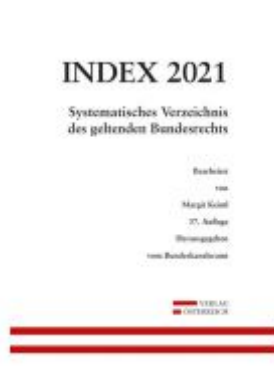
Index Bundesrecht 2021 Ladenpreis: 179,00 EUR