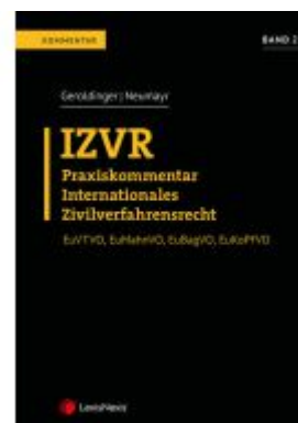
IZVR Praxiskommentar Internationales Zivilverfahrensrecht Ladenpreis: 139,00 EUR