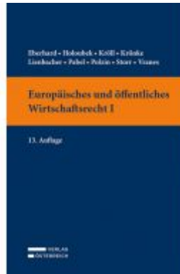
Europäisches und öffentliches Wirtschaftsrecht I Ladenpreis: 39,00 EUR