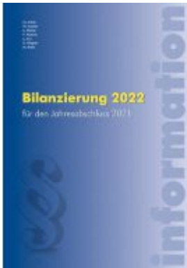
Bilanzierung 2022 Ladenpreis: 48,00 EUR