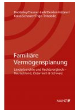
Familiäre Vermögensplanung Ladenpreis: 148,00 EUR