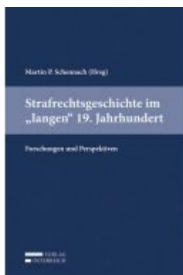
Strafrechtsgeschichte im "langen" 19. Jahrhundert Ladenpreis: 69,00 EUR