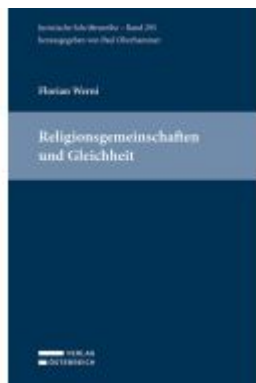
Religiösgemeinschaften und Gleichheit Ladenpreis: 145,00EUR

Wir haben andere Produkte gefunden, die Ihnen gefallen könnten!