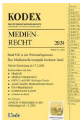
KODEX Medienrecht Ladenpreis: 37,00EUR