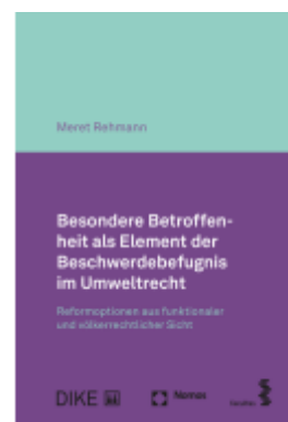
Besondere Betroffenheit als Element der Beschwerdebefugnis im Umweltrecht Ladenpreis: 117,20EUR