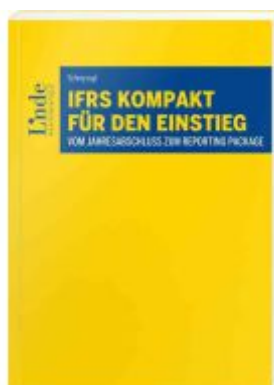
IFRS kompakt für den Einstieg Ladenpreis: 28,00EUR