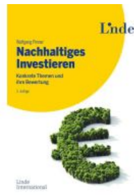
Nachhaltiges Investieren Ladenpreis: 39,00EUR