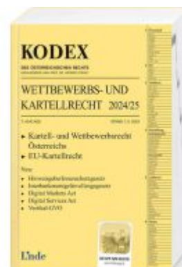
KODEX Wettbewerbs- und Kartellrecht 2024/25 Ladenpreis: 73,00EUR