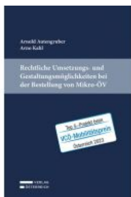
Rechtliche Umsetzungs- und Gestaltungsmöglichkeiten bei der Bestellung von Mikro-ÖV Ladenpreis: 39,00EUR