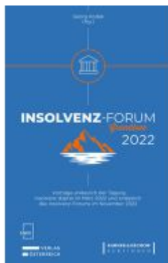
Insolvenz-Forum 2022 Ladenpreis: 78,00EUR