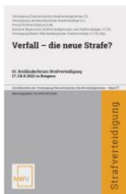
Verfall - die neue Strafe? Ladenpreis: 58,00EUR