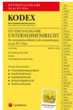
KODEX Unternehmensrecht für wirtschaftsrechtliche LVA 2024 - inkl. App Ladenpreis: 26,00EUR