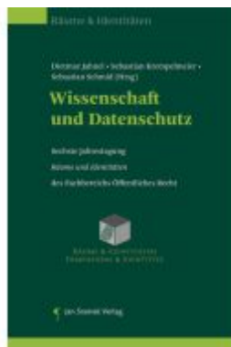
Wissenschaft und Datenschutz Ladenpreis: 55,00EUR