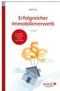
Erfolgreicher Immobilienerwerb Ladenpreis: 23,80EUR