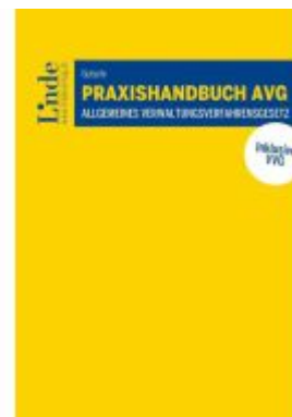
Praxishandbuch AVG | Allgemeines Verwaltungsverfahrensgesetz Ladenpreis: 49,00EUR