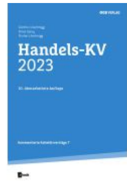
Handels-KV 2023 Ladenpreis: 42,00EUR