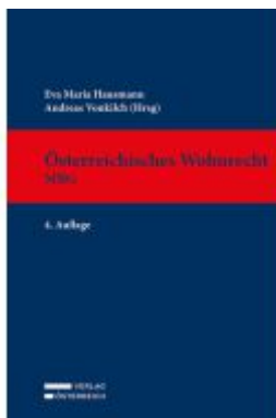
Österreichisches Wohnrecht - MRG Ladenpreis: 269,00EUR