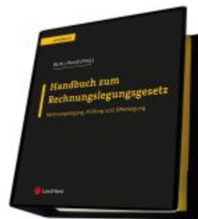
Handbuch zum Rechnungslegungsgesetz - Rechnungslegung, Prüfung und Offenlegung Ladenpreis: 536,00EUR