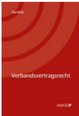
Verbandsvertragsrecht Ladenpreis: 138,00EUR

Wir haben andere Produkte gefunden, die Ihnen gefallen könnten!