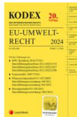
KODEX EU-Umweltrecht 2023/24 - inkl. App Ladenpreis: 108,00EUR