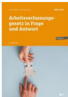
Arbeitsverfassungsgesetz in Frage und Antwort Ladenpreis: 36,00EUR