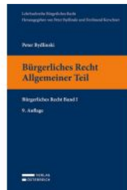
Bürgerliches Recht I. Allgemeiner Teil Ladenpreis: 33,00EUR