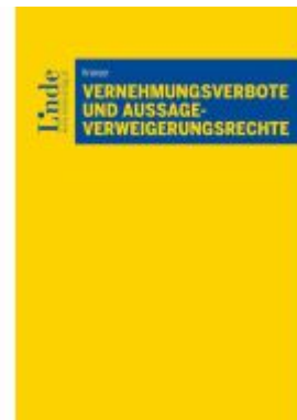
Vernehmungssverbote und Aussageverweigerungsrechte Ladenpreis: 29,00EUR