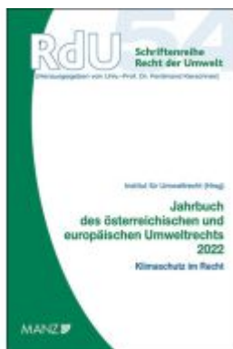
Jahrbuch des österreichischen und europäischen Umweltrechts 2022 Ladenpreis: 58,00EUR