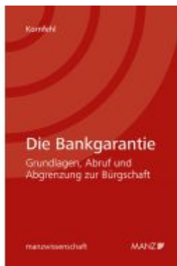
Die Bankgarantie Ladenpreis: 46,00EUR