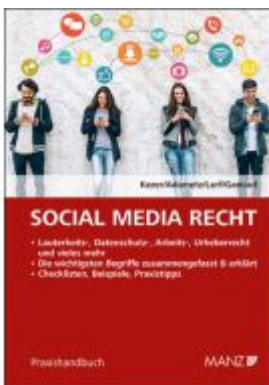
Social Media Recht Ladenpreis: 42,00EUR