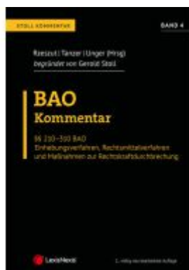
BAO Bundesabgabenordnung – Stoll Kommentar Band 4 Ladenpreis: 196,00EUR