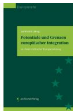
Potentiale und Grenzen europäischer Integration Ladenpreis: 85,00EUR