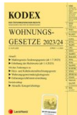
KODEX Wohnungsgesetze 2023/24 - inkl. App Ladenpreis: 59,00EUR