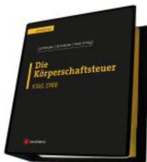
Die Körperschaftsteuer (KStG 1988) Ladenpreis: 450,00EUR