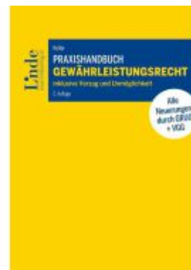
Praxishandbuch Gewährleistungsrecht Ladenpreis: 49,00EUR