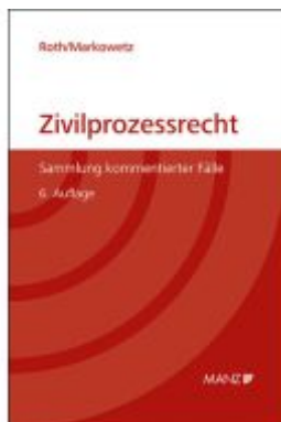
Zivilprozessrecht Sammlung kommentierter Fälle Ladenpreis: 46,00EUR