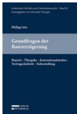
Grundfragen der Bauverzögerung Ladenpreis: 79,00EUR