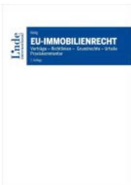
EU-Immobilienrecht Ladenpreis: 52,00EUR