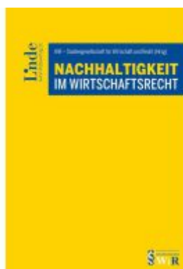
Nachhaltigkeit im Wirtschaftsrecht Ladenpreis: 69,00EUR