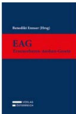
EAG - Erneuerbaren-Ausbau-Gesetz Ladenpreis: 89,00EUR