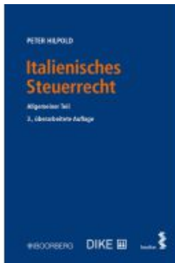
Italienisches Steuerrecht Ladenpreis: 46,00EUR