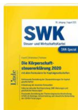
SWK-Spezial Die Körperschaftsteuererklärung 2020 Ladenpreis: 48,00EUR