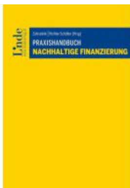
Praxishandbuch Nachhaltige Finanzierung Ladenpreis: 66,00EUR