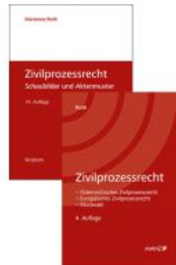
PAKET: Zivilprozessrecht 4.Auflage+ Zivilprozessrecht Schaubilder und Aktenmuster 14.Auflage Ladenpreis: 77,40EUR