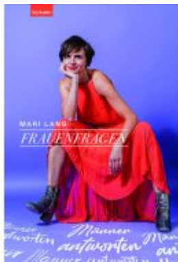
Frauenfragen - Männer antworten Ladenpreis: 22,00EUR