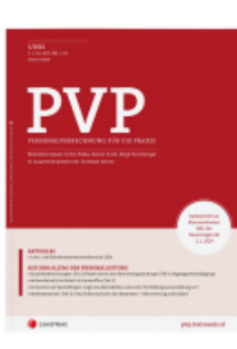
PVP Zeitschrift - Jahres-Abonnement (12 Hefte) Ladenpreis: 0,00EUR