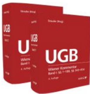
Wiener Kommentar zum UGB PAKET Band 1 + Band 2 Ladenpreis: 548,00 EUR

Wir haben andere Produkte gefunden, die Ihnen gefallen könnten!