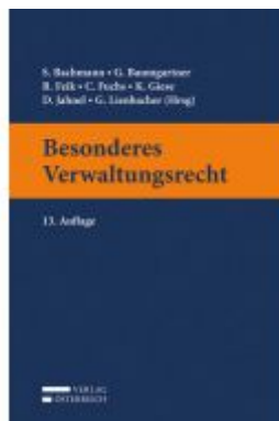
Besonderes Verwaltungsrecht Ladenpreis: 55,00 EUR