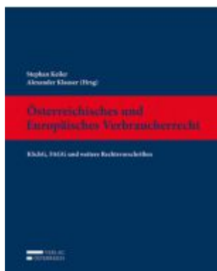
Österreichisches und Europäisches Verbraucherrecht Ladenpreis: 89,00 EUR