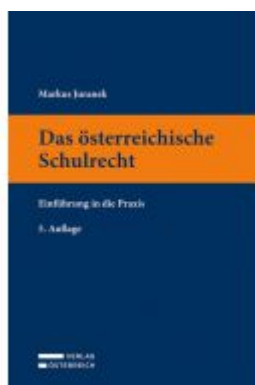
Das österreichische Schulrecht Ladenpreis: 47,00 EUR