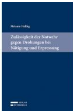
Zulässigkeit der Notwehr gegen Drohungen bei Nötigung und Erpressung Ladenpreis: 89,00 EUR