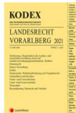
KODEX Landesrecht Vorarlberg 2021 Ladenpreis: 115,00 EUR