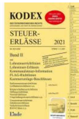
KODEX Steuer-Erlässe 2021, Band II Ladenpreis: 34,00 EUR