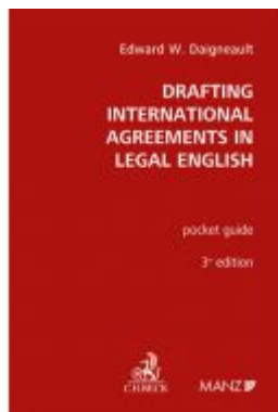
Drafting International Agreements in Legal English Ladenpreis: 36,00 EUR

Wir haben andere Produkte gefunden, die Ihnen gefallen könnten!