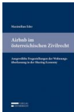
Airbnb im österreichischen Zivilrecht Ladenpreis: 53,00 EUR