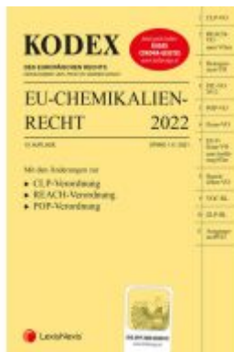
KODEX EU-Chemikalienrecht 2022 - inkl. App Ladenpreis: 95,00 EUR