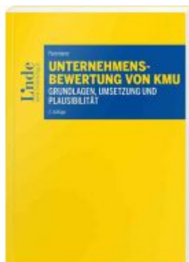
Unternehmensbewertung von KMU Ladenpreis: 59,00 EUR