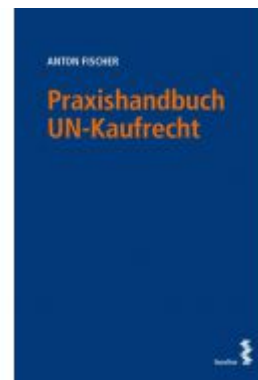
Praxishandbuch UN-Kaufrecht Ladenpreis: 48,00 EUR