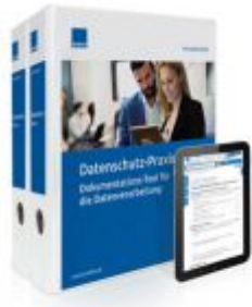
Datenschutz-Praxis Ladenpreis: 217,80 EUR