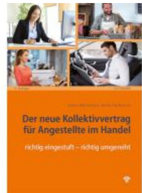
Der neue Kollektivvertrag für Angestellte im Handel Ladenpreis: 36,75 EUR