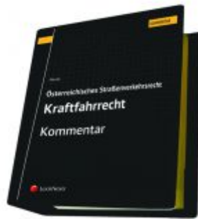
Österreichisches Straßenverkehrsrecht - Kraftfahrrecht Ladenpreis: 487,00 EUR