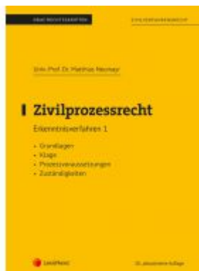
Zivilprozessrecht Erkenntnisverfahren 1 (Skriptum) Ladenpreis: 20,00 EUR