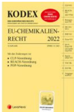
KODEX EU-Chemikalienrecht 2022 - inkl. App Ladenpreis: 95,00 EUR