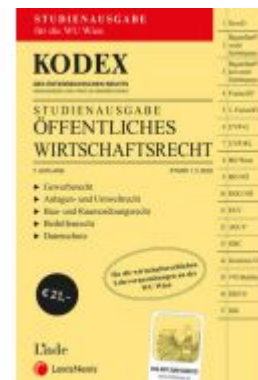
KODEX Öffentliches Wirtschaftsrecht 2022 - inkl. App Ladenpreis: 21,00 EUR