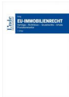
EU-Immobilienrecht Ladenpreis: 52,00 EUR