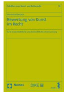
Bewertung von Kunst im Recht Ladenpreis: 77,10 EUR