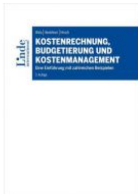
Kostenrechnung, Budgetierung und Kostenmanagement Ladenpreis: 72,00 EUR