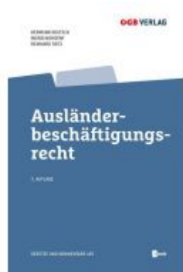
Ausländerbeschäftigungsrecht Ladenpreis: 69,90 EUR