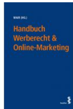
Handbuch Werberecht & Online-Marketing Ladenpreis: 65,00 EUR