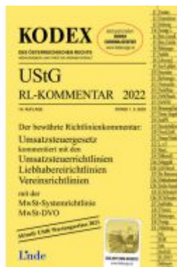
KODEX UStG-Richtlinien-Kommentar 2022 Ladenpreis: 54,00 EUR