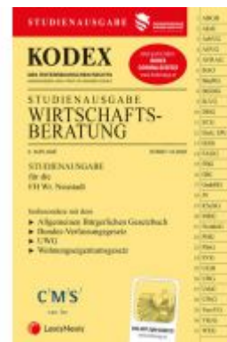
KODEX Wirtschaftsberatung 2020 Ladenpreis: 22,00 EUR