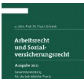
Arbeitsrecht und Sozialversicherungsrecht 2021 Ladenpreis: 348,00 EUR

Ausgabe 2021 Mit Homeoffice-Abschnitt inkl. Updatezugang: aund.lawlexnexus.at