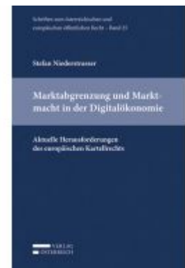
Marktabgrenzung und Marktmacht in der Digitalökonomie Ladenpreis: 49,00 EUR