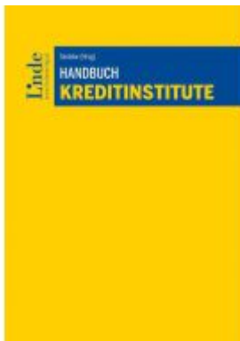
Handbuch Kreditinstitute Ladenpreis: 98,00 EUR

Wir haben andere Produkte gefunden, die Ihnen gefallen könnten!