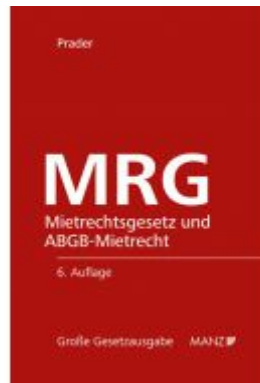
MRG - Mietrechtsgesetz und ABGB- Mietrecht Ladenpreis: 194,00 EUR