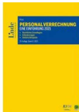
Personalverrechnung: eine Einführung 2021 Ladenpreis: 38,00 EUR