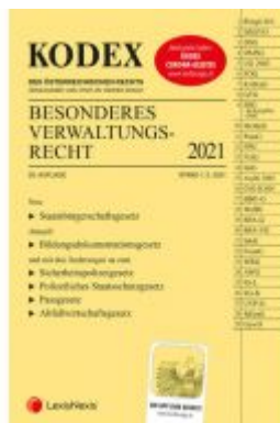
KODEX Besonderes Verwaltungsrecht 2021 Ladenpreis: 69,00 EUR