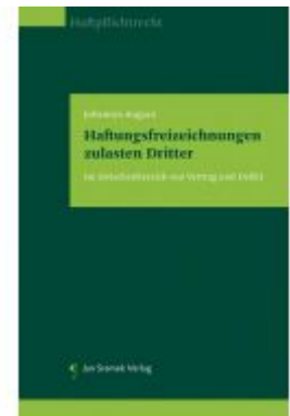
Haftungsfreizeichnungen zulasten Dritter Ladenpreis: 78,00 EUR