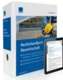
Rechtshandbuch Bauwirtschaft Ladenpreis: 217,80 EUR