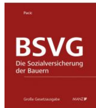
Die Sozialversicherung der Bauern BSVG Ladenpreis: 296,00 EUR