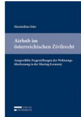
Airbnb im österreichischen Zivilrecht Ladenpreis: 53,00 EUR