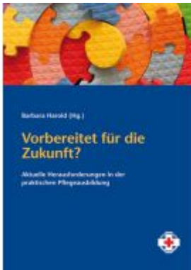
Vorbereitet für die Zukunft? Ladenpreis: 6,90 EUR

Wir haben andere Produkte gefunden, die Ihnen gefallen könnten!