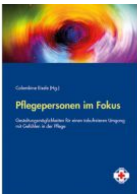
Pflegepersonen im Fokus Ladenpreis: 14,90 EUR