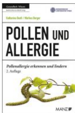
Pollen und Allergie Ladenpreis: 23,90 EUR