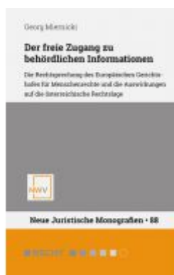
Der freie Zugang zu behördlichen Informationen Ladenpreis: 68,00 EUR