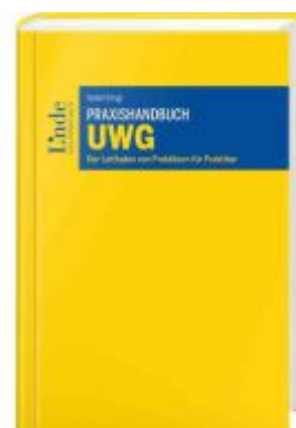
Praxishandbuch UWG Ladenpreis: 98,00 EUR