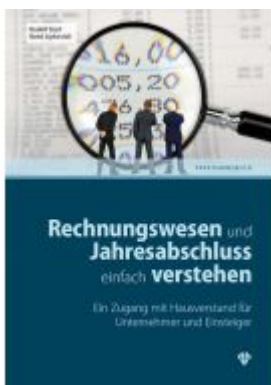
Rechnungswesen und Jahresabschluss einfach verstehen Ladenpreis: 36,00 EUR