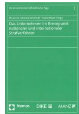
Das Unternehmen im Brennpunkt nationaler und internationaler Strafverfahren Ladenpreis: 64,00 EUR