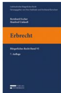
Erbrecht Ladenpreis: 28,00 EUR