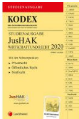
KODEX JusHAK Ladenpreis: 23,00 EUR

Wir haben andere Produkte gefunden, die Ihnen gefallen könnten!