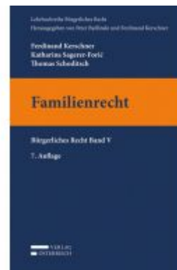
Familienrecht Ladenpreis: 28,00 EUR