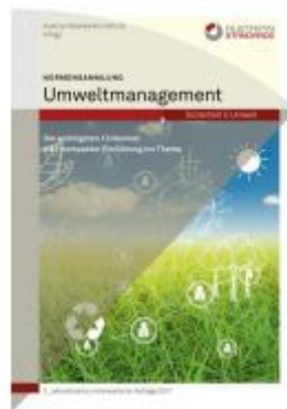
Normensammlung Umweltmanagement Ladenpreis: 309,90 EUR