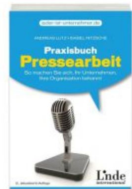
Praxisbuch Pressearbeit Ladenpreis: 18,40 EUR