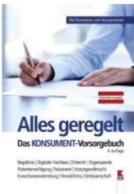
Alles geregelt. Das KONSUMENT-Vorsorgebuch Ladenpreis: 19,90 EUR