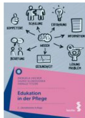
Edukation in der Pflege Ladenpreis: 24,90EUR