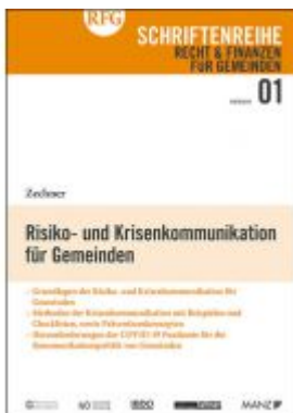
Risiko- und Krisenkommunikation für Gemeinden Ladenpreis: 18,00EUR