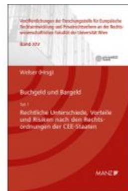
Buchgeld und Bargeld - Teil 1: Rechtliche Unterschiede und Risiken nach den Rechtsordnungen der CEE-Staaten Ladenpreis: 64,00EUR