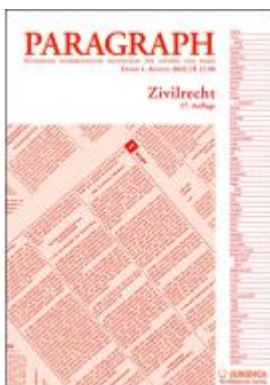
Paragraph - Zivilrecht Ladenpreis: 17,90EUR