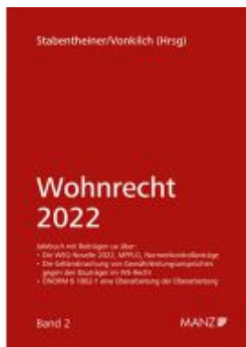
Wohnrecht 2022 Ladenpreis: 46,00EUR