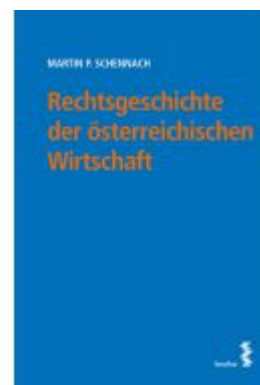
Rechtsgeschichte der österreichischen Wirtschaft Ladenpreis: 38,00EUR