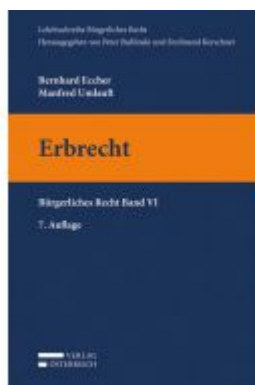
Erbrecht Ladenpreis: 28,00EUR