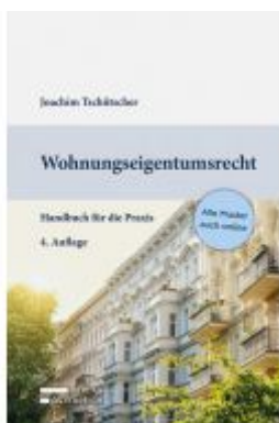
Wohnungseigentumsrecht Ladenpreis: 69,00EUR