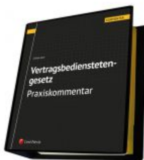
Vertragsbedienstetengesetz - Praxiskommentar Ladenpreis: 330,00EUR