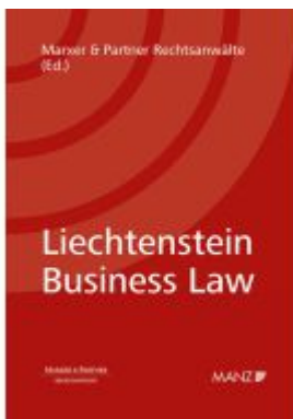
Liechtenstein Business Law Ladenpreis: 142,00EUR