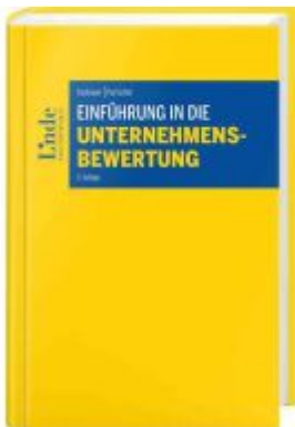
Einführung in die Unternehmensbewertung Ladenpreis: 85,00EUR