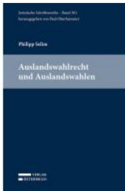
Auslandswahlrecht und Auslandswahlen Ladenpreis: 69,00EUR