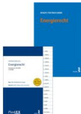
Kombipaket Energierecht und FlexLex Energierecht Ladenpreis: 48,00EUR