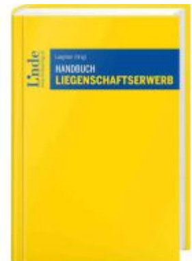
Handbuch Liegenschaftserwerb Ladenpreis: 49,00EUR