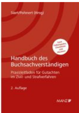
Handbuch des Buchsachverständigen Ladenpreis: 118,00EUR