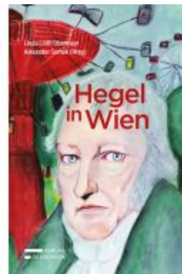
Hegel in Wien Ladenpreis: 55,00EUR