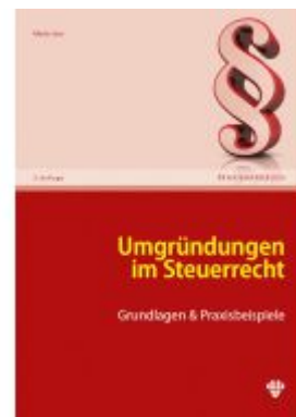
Umgründungen um Steuerrecht Ladenpreis: 59,40EUR