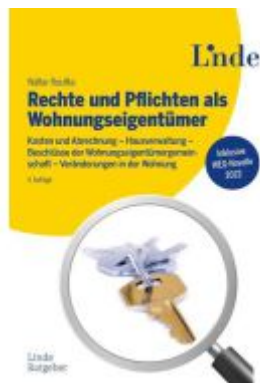
Rechte und Pflichten als Wohnungseigentümer Ladenpreis: 48,00EUR