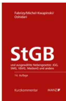
Strafgesetzbuch StGB Ladenpreis: 178,00EUR