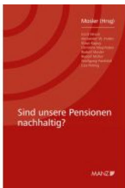
Sind unsere Pensionen nachhaltig? Ladenpreis: 28,00EUR