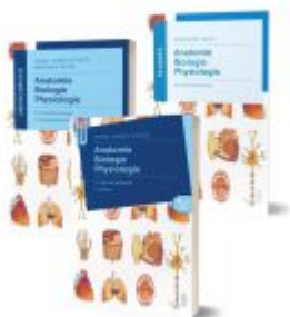
Lernpaket Anatomie, Biologie, Physiologie II Ladenpreis: 66,90EUR

Wir haben andere Produkte gefunden, die Ihnen gefallen könnten!