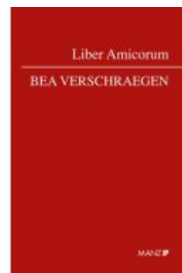
Liber Amicorum Bea Verschraegen Ladenpreis: 74,00EUR