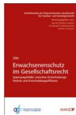
Erwachsenenschutz im Gesellschaftsrecht Ladenpreis: 108,00EUR