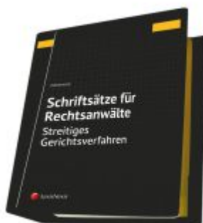
Schriftsätze für Rechtsanwälte - Streitiges Gerichtsverfahren Ladenpreis: 189,00EUR