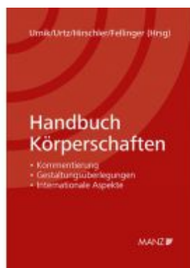
Handbuch Körperschaften Ladenpreis: 148,00 EUR