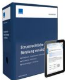
Steuerrechtliche Beratung von Ärzten Ladenpreis: 239,80 EUR