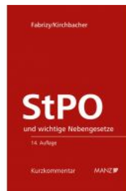
Strafprozessordnung - StPO Ladenpreis: 178,00 EUR