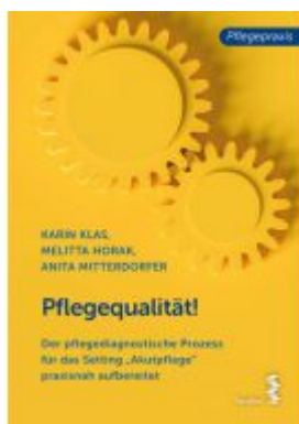
Pflegequalität! Ladenpreis: 9,90 EUR