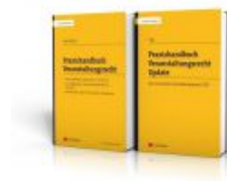
Praxishandbuch Veranstaltungsrecht + Update Ladenpreis: 79,00 EUR