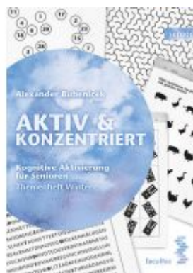
Aktiv & Konzentriert Ladenpreis: 17,90 EUR