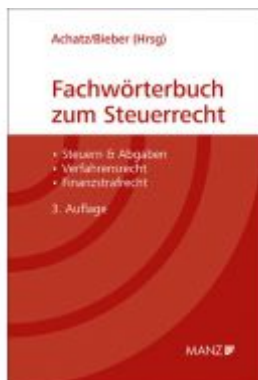
Fachwörterbuch zum Steuerrecht Ladenpreis: 81,00 EUR