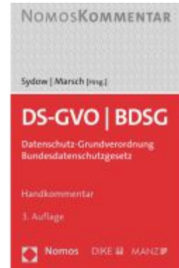
DS-GVO / BDSG Ladenpreis: 189,00EUR