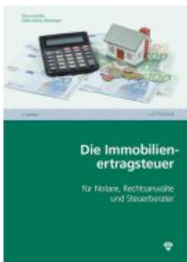
Die Immobilien-ertragsteuer Ladenpreis: 27,50EUR

Wir haben andere Produkte gefunden, die Ihnen gefallen könnten!