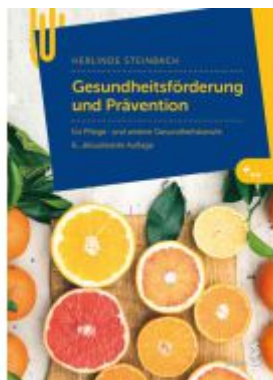
Gesundheitsförderung und Prävention Ladenpreis: 29,90EUR