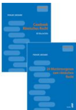
Kombipaket Casebook Römisches Recht und 24 Musterexegesen zum römischen Recht Ladenpreis: 58,00EUR