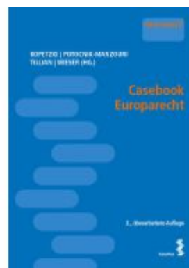
Casebook Europarecht Ladenpreis: 29,00EUR