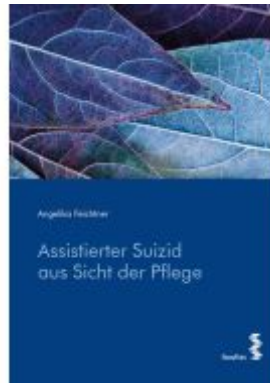
Assistierter Suizid aus Sicht der Pflege Ladenpreis: 19,90EUR