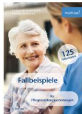
Fallbeispiele für Pflegeassistentenausbildungen Ladenpreis: 24,90EUR