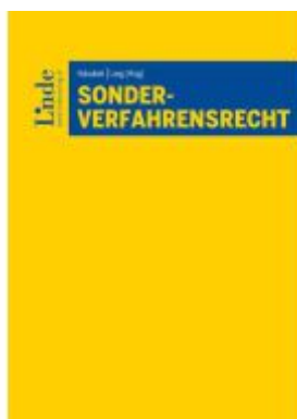
Sonderverfahrensrecht Ladenpreis: 125,00EUR