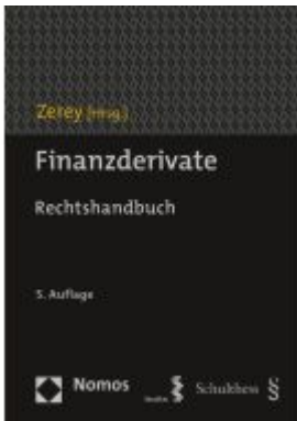
Finanzderivate Ladenpreis: 204,60EUR