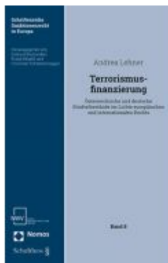
Terrorismusfinanzierung Ladenpreis: 68,00 EUR