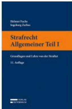
Strafrecht Allgemeiner Teil I Ladenpreis: 52,00 EUR