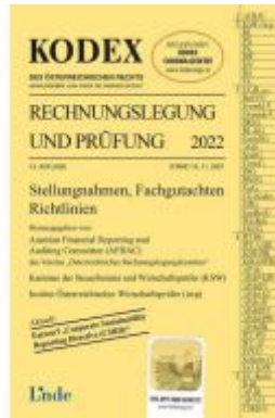
KODEX Rechnungslegung und Prüfung 2022 Ladenpreis: 57,00 EUR