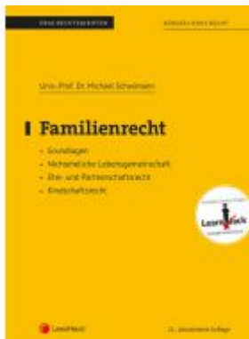
Familienrecht (Skriptum) Ladenpreis: 19,00 EUR

Wir haben andere Produkte gefunden, die Ihnen gefallen könnten!