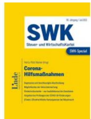
SWK-Spezial Corona-Hilfsmaßnahmen Ladenpreis: 60,00 EUR