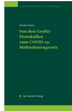
Von den Genfer Protokollen zum COVID-19-Maßnahmegesetz Ladenpreis: 39,90 EUR