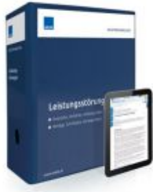
Mustersammlung Leistungsstörungen Ladenpreis: 239,80 EUR