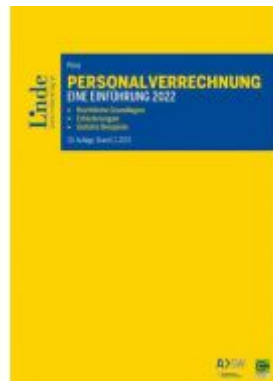
Personalverrechnung: eine Einführung 2022 Ladenpreis: 40,00 EUR