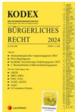
KODEX Bürgerliches Recht 2024 - inkl. App Ladenpreis: 40,00EUR

Wir haben andere Produkte gefunden, die Ihnen gefallen könnten!