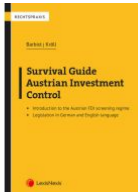
Survival Guide Austrian Investment Control Ladenpreis: 24,00EUR