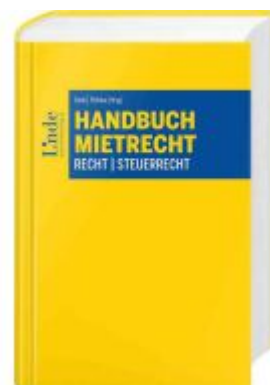
Handbuch Mietrecht Ladenpreis: 160,00EUR