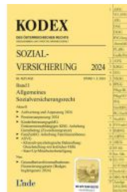
KODEX Sozialversicherung 2024, Band I Ladenpreis: 46,00EUR