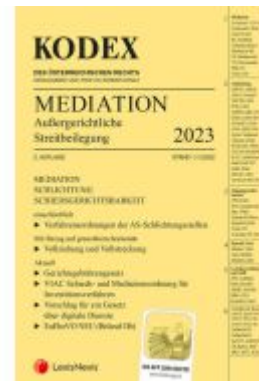
KODEX Mediation 2023 Ladenpreis: 32,00EUR