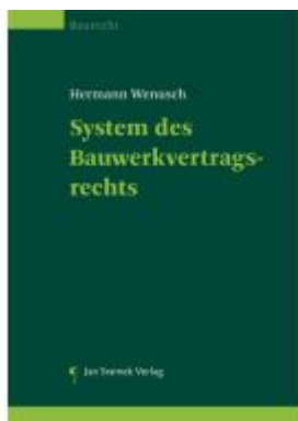
System des Bauwerkvertragsrechts Ladenpreis: 165,00EUR