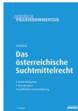
Das österreichische Suchtmittelrecht Ladenpreis: 59,00EUR