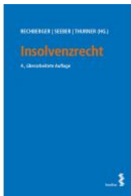
Insolvenzrecht Ladenpreis: 36,00EUR