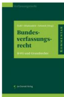
Kommentar zum Bundesverfassungsrecht Ladenpreis: 248,00EUR