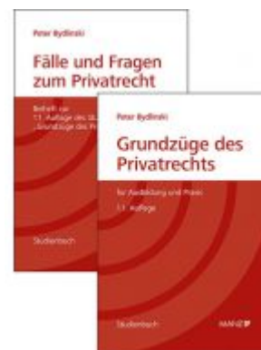
PAKET: Grundzüge des Privatrechts + Fälle und Fragen zum Privatrecht 11. Auflage Ladenpreis: 64,00EUR