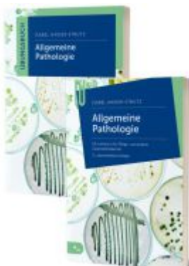
Lernpaket Allgemeine Pathologie Ladenpreis: 41,90EUR

Wir haben andere Produkte gefunden, die Ihnen gefallen könnten!