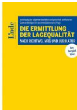
Die Ermittlung der Lagequalität nach RichtWG, MRG und Judikatur Ladenpreis: 39,00EUR