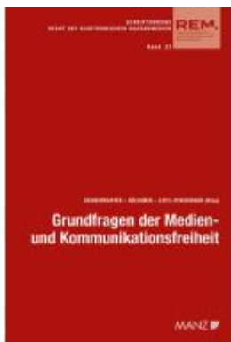
Grundfragen der Medien- und Kommunikationsfreiheit Ladenpreis: 54,00EUR