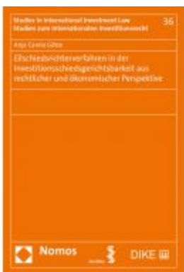
Eilschiedsrichterverfahren in der Investitionsschiedsgerichtsbarkeit aus rechtlicher und ökonomischer Perspektive Ladenpreis: 74,00EUR