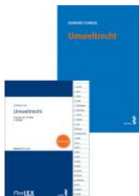
Kombipaket Umweltrecht und FlexLex Umweltrecht | Studium Ladenpreis: 53,00EUR