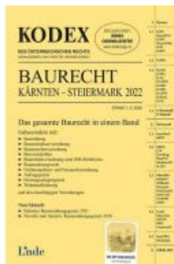
KODEX Baurecht Kärnten - Steiermark 2022 Ladenpreis: 62,00 EUR