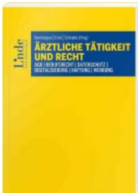
Ärztliche Tätigkeit und Recht Ladenpreis: 48,00 EUR