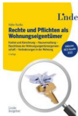
Rechte und Pflichten als Wohnungseigentümer Ladenpreis: 48,00 EUR