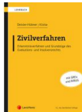
Zivilverfahren Ladenpreis: 66,00 EUR