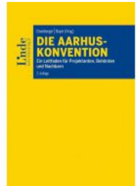
Die Aarhus-Konvention Ladenpreis: 46,00 EUR