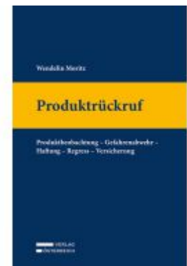
Produktrückruf Ladenpreis: 129,00 EUR