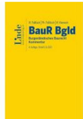
BauR Bgld. | Burgenländisches Baurecht Ladenpreis: 239,00EUR