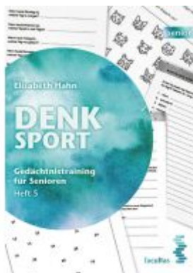
Denksport Ladenpreis: 14,90EUR