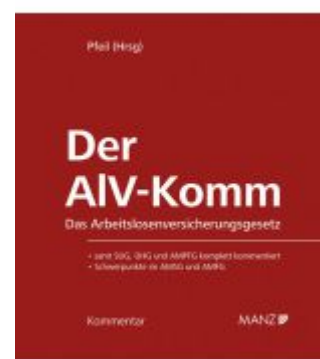
Der AIV-Komm Das Arbeitslosenversicherungsgesetz Ladenpreis: 198,00EUR