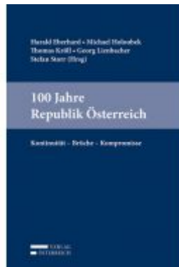
100 Jahre Republik Österreich Ladenpreis: 98,00EUR