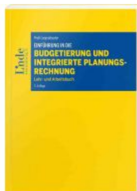
Einführung in die Budgetierung und integrierte Planungsrechnung Ladenpreis: 36,00EUR