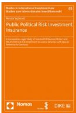
Public Political Risk Investment Insurance Ladenpreis: 412,90EUR