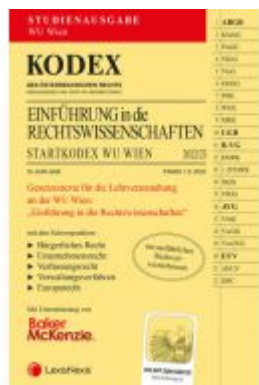
KODEX Einführung in die Rechtswissenschaften 2022/23 - inkl. App Ladenpreis: 18,00EUR