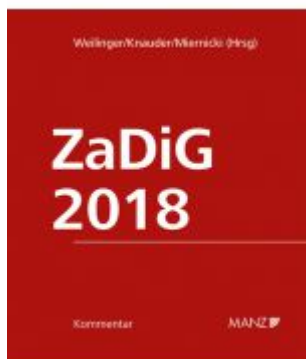
ZaDiG 2018 Ladenpreis: 298,00EUR