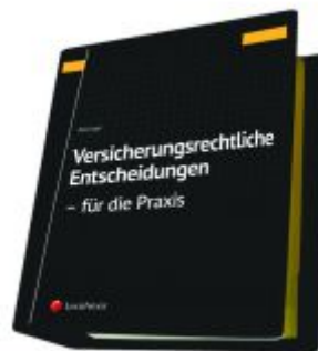
Versicherungsrechtliche Entscheidungen - aufbereitet für die Praxis Ladenpreis: 329,00 EUR