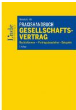
Praxishandbuch Gesellschaftsvertrag Ladenpreis: 74,00 EUR