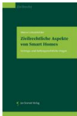
Zivilrechtliche Aspekte von Smart Homes Ladenpreis: 55,00 EUR