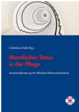
Moralischer Stress in der Pflege Ladenpreis: 14,90 EUR

Wir haben andere Produkte gefunden, die Ihnen gefallen könnten!