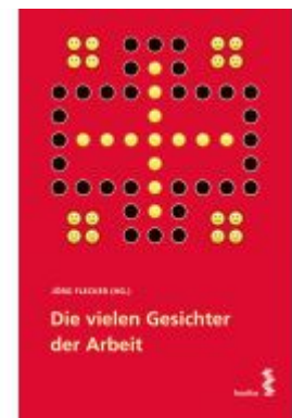
Die vielen Gesichter der Arbeit Ladenpreis: 29,00 EUR