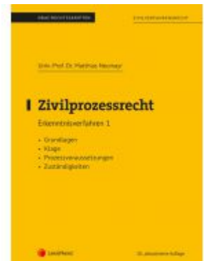
Zivilprozessrecht Erkenntnisverfahren 1 (Skriptum) Ladenpreis: 20,00 EUR