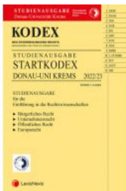
KODEX Startkodex Krens 2022/23 - inkl. App Ladenpreis: 28,00 EUR