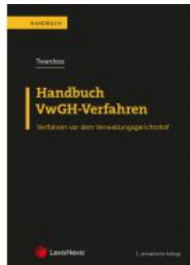
Handbuch VwGH-Verfahren Ladenpreis: 69,00 EUR