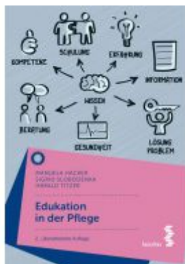
Eduktion in der Pflege Ladenpreis: 24,90 EUR